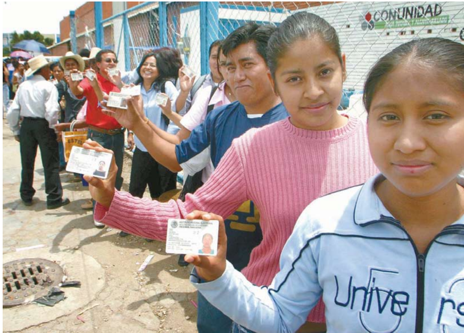
El próximo año, más de cuatro millones de jóvenes que tienen entre 18 y 19 años tendrán por primera vez la oportunidad de votar en un proceso electoral federal.

Para las elecciones federales del próximo año, los partidos políticos tendrán la tarea de convencer a más de 4.1 millones de jóvenes que podrán votar por primera vez, pues este sector social representa la mejor oferta electoral. De acuerdo con los registros oficiales, el volumen de esta nueva generación en los comicios tiene la capacidad para determinar los resultados en los distritos con alta competencia política